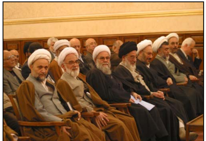
مسئولان قوه قضائیه و دیوان عالی کشور از چپ به راست: عباسعلی علیزاده- قربانعلی دری نجف آبادی- حسین مفید- محمودهاشمی شاهرودی- علی یونسی- حسینعلی نیری- اسماعیل شوشتری