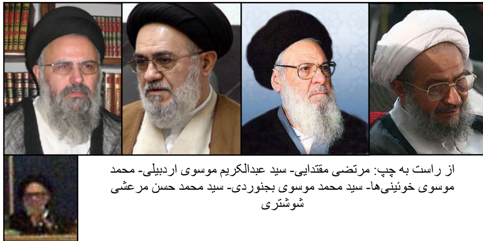
از راست به چپ: مرتضی مقتدایی - سید عبدالکریم موسوی اردبیلی - محمد موسوی خوئینی‌ها - سید محمد موسوی بجنوردی - سید محمد حسن مرعشی شوشتری