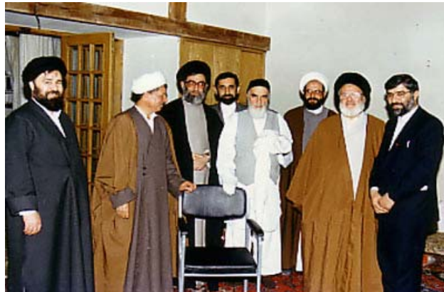
از چپ به راست، میرحسین موسوی، عبدالکریم موسوی اردبیلی، محمدمحمدری شهری، روح الله خمینی، علی اکبر ولایتی، سیدعلی خامنه‌ای، علی اکبر هاشمی رفسنجانی، سیداحمد خمینی

تصویر اعضای تعیین کننده دولت و حکومت اسلامی در حضور خمینی، چنین ترکیبی برای تصمیم گیری در امور مهم دور هم جمع می شدند.