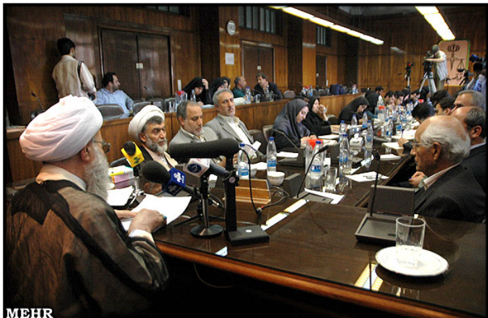
مصاحبه مطبوعاتی حسین مفید رییس دیوان عالی کشور نفر اول از سمت چپ حسینعلی نیری معاون قضایی دیوان عالی کشور